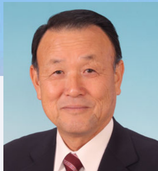
北 猛俊 市長

1954年生まれ。北海道空知郡中富良野町出身。 富良野高等学校、北海道拓殖短期大を卒業後、1975年4月より実家の農業に従事。 1995年4月に富良野市議会議員に初当選。 2007年5月から17年12月まで富良野市議会議長を務め、 2018年5月に富良野市長に就任。現在2期目